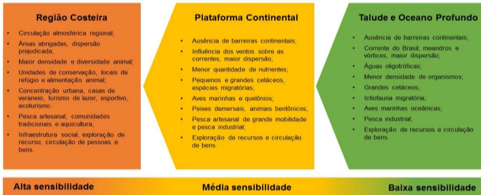
Figura II.5.4.1.2-4 – Sensibilidade relativa com relação às interações entre os compartimentos físico, biótico e socioeconômico. A classificação de sensibilidade se aplica a todo o compartimento relativamente aos demais e, não necessariamente, as características isoladamente possuem a sensibilidade indicada (grandes cetáceos, por exemplo, possuem de modo geral alta sensibilidade, contudo estão englobados em um contexto de baixa sensibilidade no Talude e Oceano Profundo, quando este compartimento de forma geral é comparado à Região Costeira).