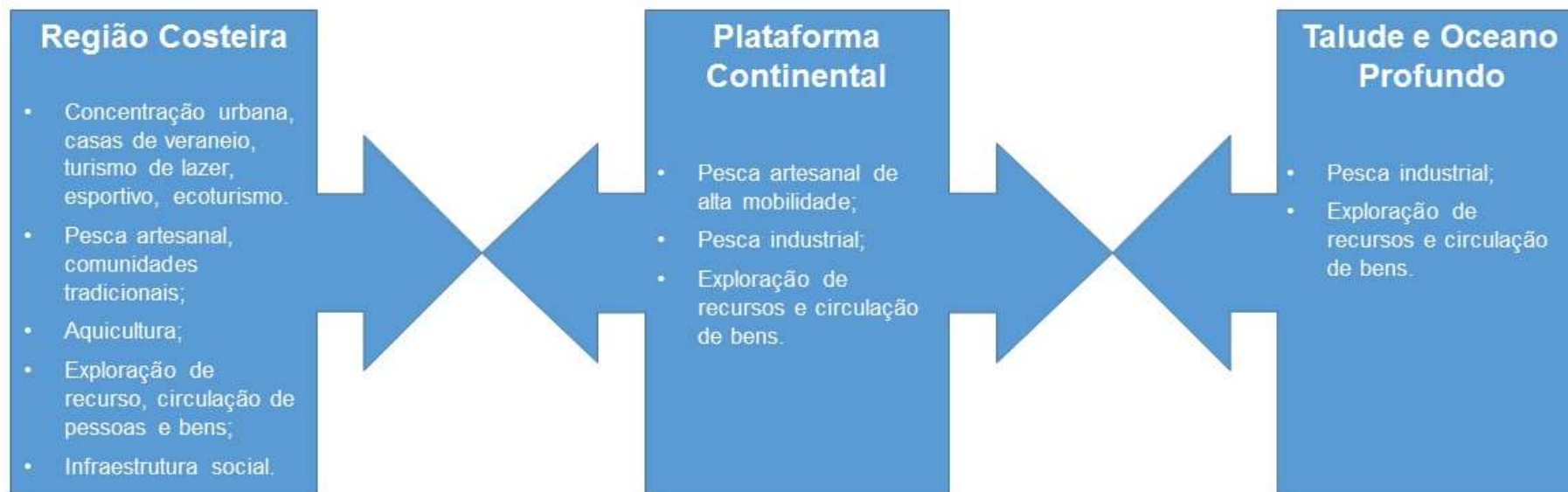
Figura II.5.4.1.2-3 – Inter-relações socioeconômicas predominantes no contexto dos ambientes físico e biótico.