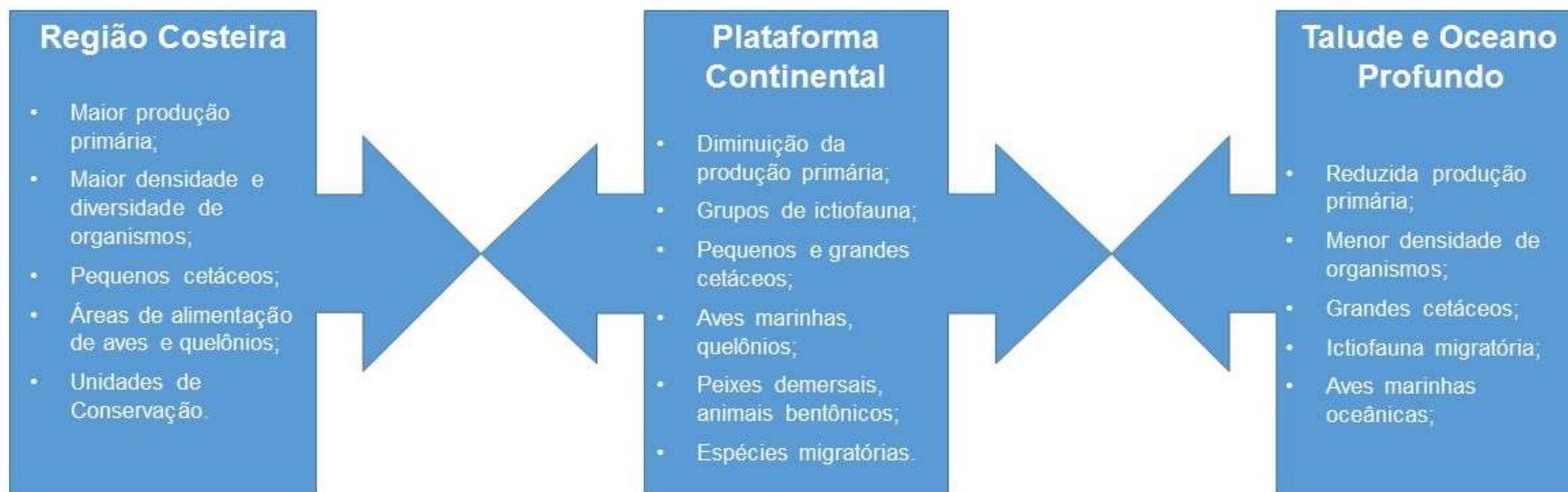
Figura II.5.4.1.2-2 – Ambientes predominantes no contexto de inter-relações no ambiente biótico.